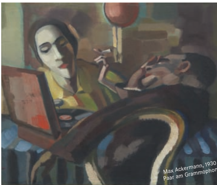
Max Ackermann, 1930 Paar am Grammophon